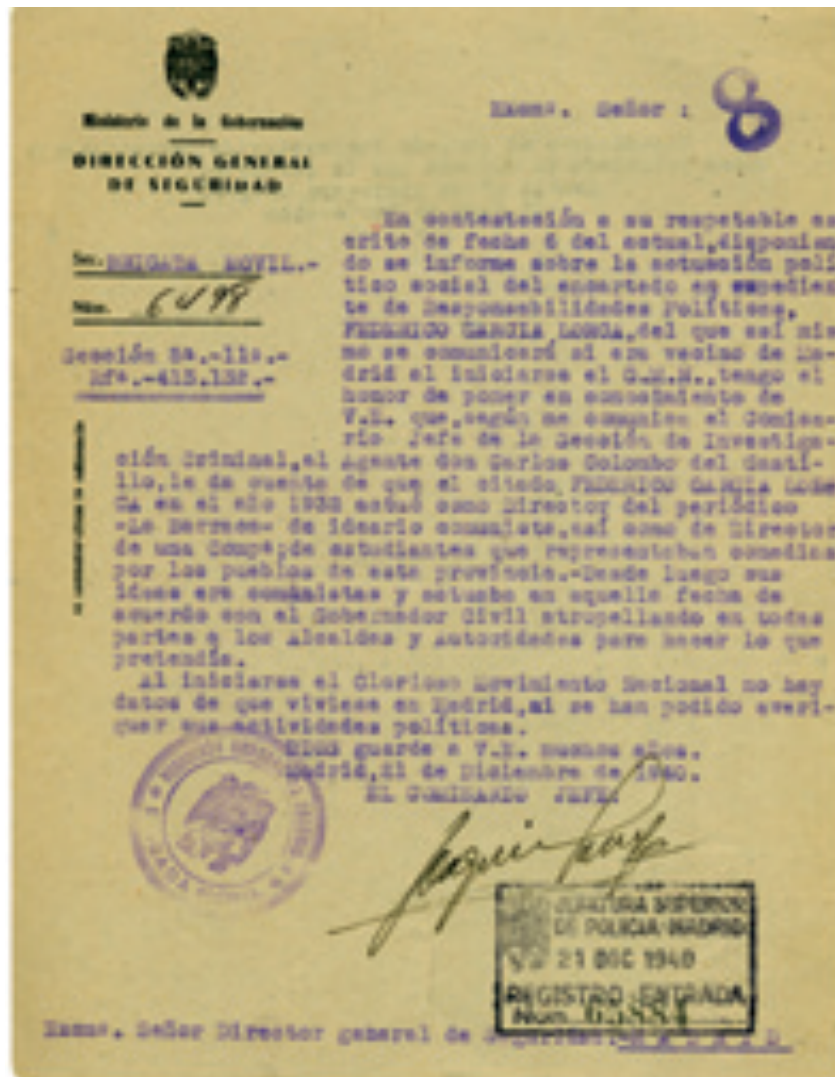
Expediente policial sobre FGL: Ministerio de la Gobernación, Dirección General de Seguridad, Investigación y Vigilancia (1940). Archivo Histórico Nacional.

Con el golpe de estado de 1936 y el asesinato de Federico García Lorca, sus manuscritos corrieron el peligro de extraviarse o ser destruidos. «Memoria en movimiento» comienza explorando la forma en que el poeta mismo había manejado y conservado sus papeles y cómo repercutió la guerra civil en los innumerables proyectos creativos que llevaba en la cabeza o tenía entre manos, algunos muy avanzados que no obstante quedaron inconclusos o sin publicar. También se revelan los esfuerzos que hicieron su familia, parientes y amigos para poner a salvo sus manuscritos, dejados en el piso familiar de la madrileña calle de Alcalá, escondidos en una maleta en Granada o —en cierto momento— en un almiar de la Vega.