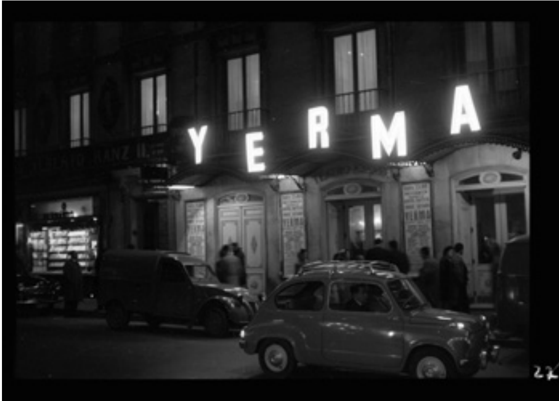
El exterior del teatro Eslava de Madrid en la noche del estreno de Yerma (21 de octubre de 1960), fotografiado por Gyenes. Ministerio de Educación, Cultura y Deporte. Centro de Documentación de las Artes Escénicas y la Música (INAEM)